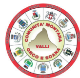
Comunità Montana Valli Orco e Soana